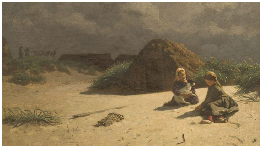
Det tidlige Skagen – parti fra Nymindegab (Anders Tuxen)

Omkring århundredeskiftet (1800 til 1900) blev Nymindegab genstand for en hidtil uset interesse. Kunstnere og borgerskab begyndte at indfinde sig.