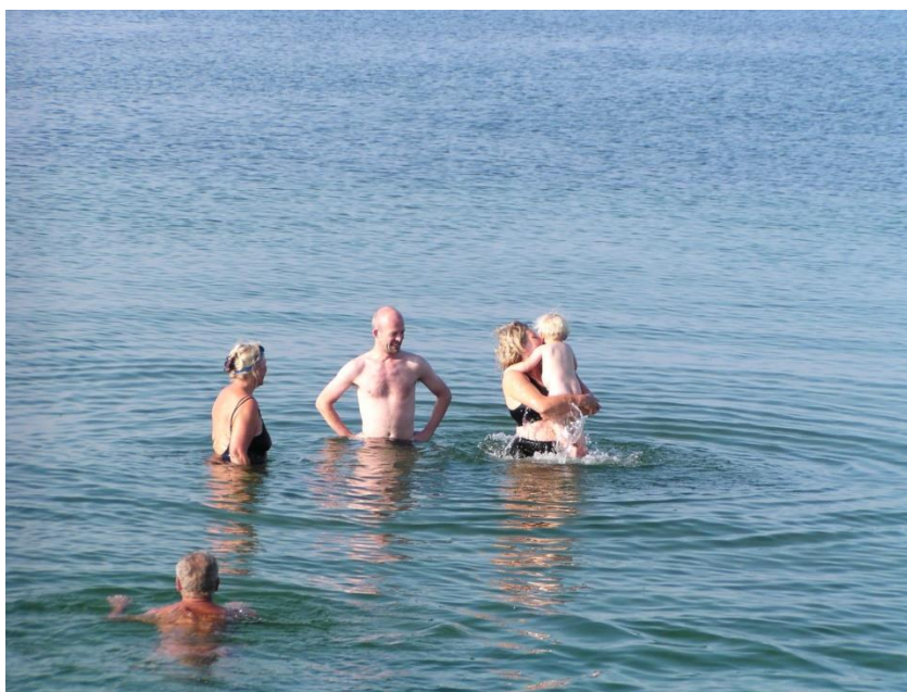
Badeliv i Køge bugt