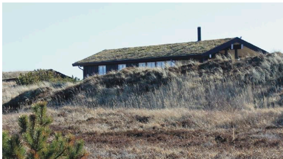
Med den ny hjemmeside har beboerne i Rødhus Klit fået nem adgang til bl.a. folder om områdets særpræg. Billedet stammer fra en sådan.

Find tilmeldingsblanket på www.mifritidshus.dk