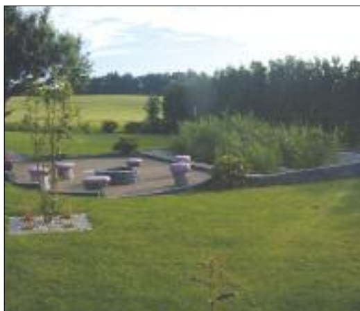
Det beplantede filter integreret i en have.

(**) kilde: forskellige leverandører af biologiske mini-renses-anlæg